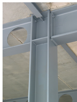
Søjle / bjælke